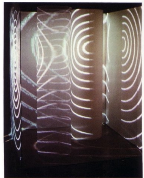
T. Bortnyik Éva–Tubák Csaba: Transit VI , 1996, videoinstalláció